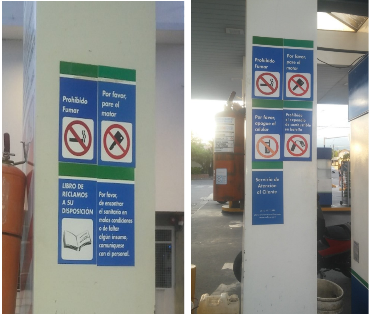
Señales de prohibición