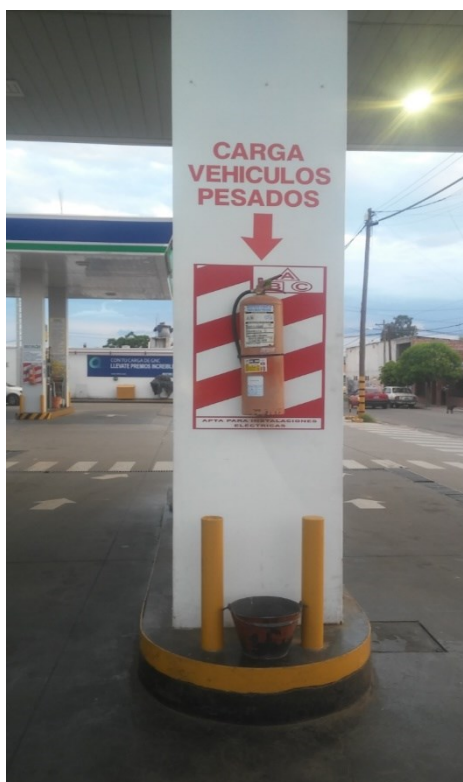
Desniveles identificados en Playa de Pesados

*Desniveles que puedan originar caídas, por ejemplo: primer y último tramo de escalera, bordes de plataformas, fosas, barreras o vallas, barandas, pilares, postes, partes salientes de instalaciones o artefacto que se prolonguen dentro de las áreas de pasajes normales y que puedan ser chocados o golpeados.