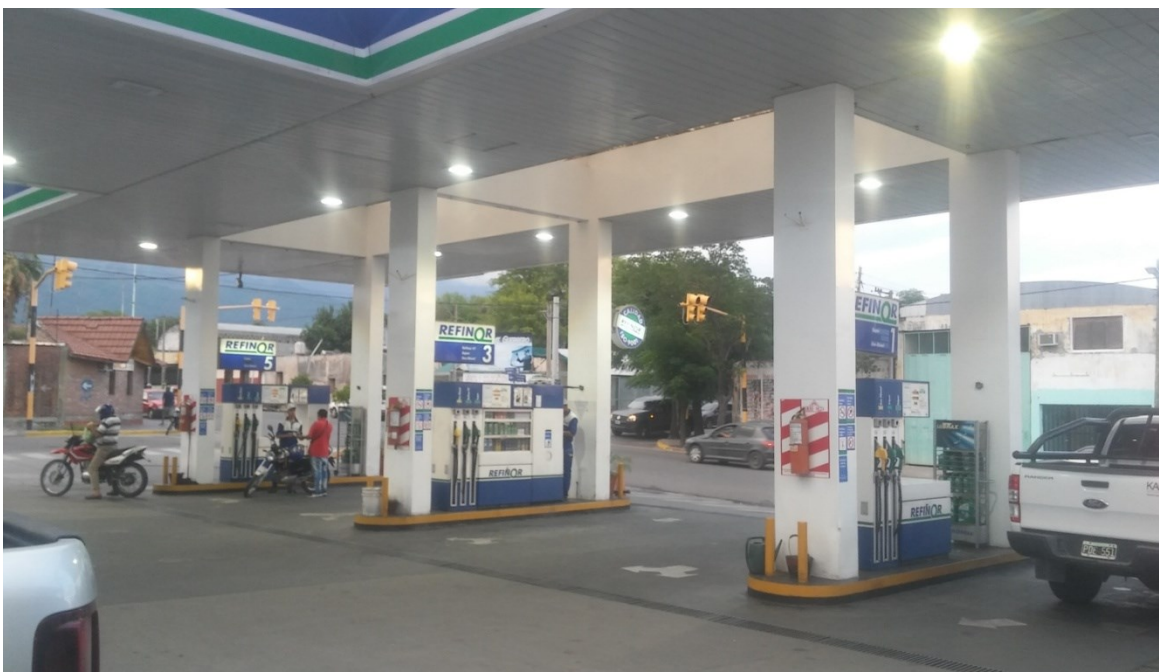
Extintores en playa de livianos