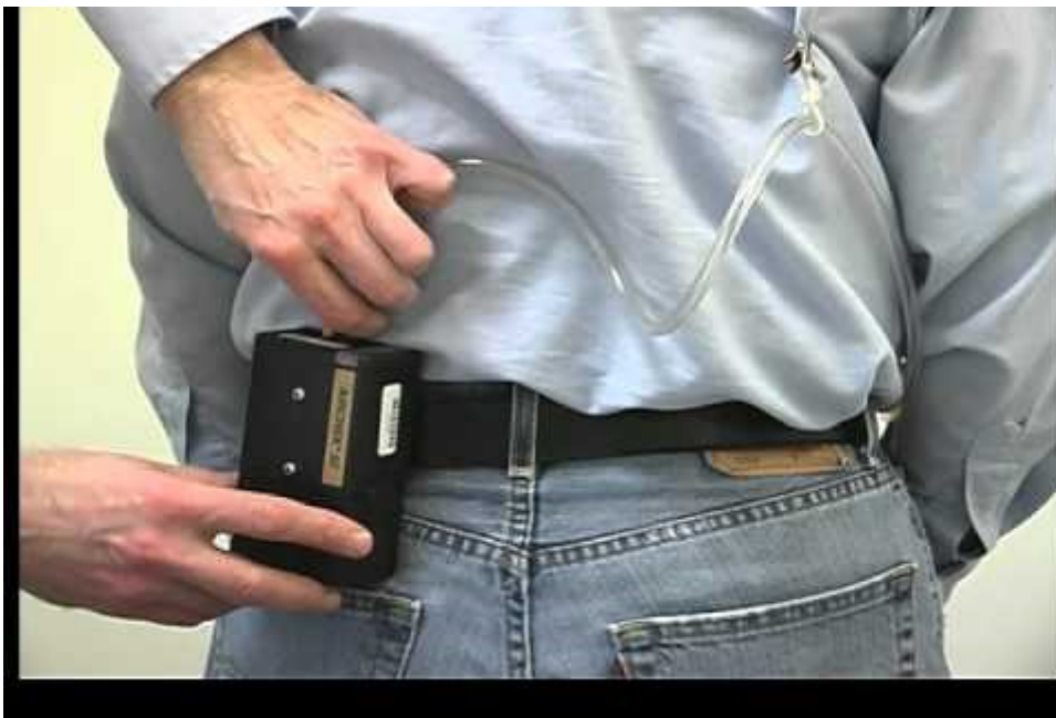
Bomba de muestreo personal

La muestra se recoge, utilizando una bomba de muestreo personal calibrada (muestreo activo), haciendo pasar una cantidad conocida de aire a través de un elemento captador, que es un tubo relleno con material adsorbente generalmente de carbón activado. Posteriormente los vapores se desorben utilizando disolventes, solos o en mezclas de sulfuro de carbono, metanol o diclorometano. La disolución resultante se analiza en un cromatógrafo de gases (GC por sus siglas en inglés) equipado con detector de ionización de llama (FID por sus siglas en inglés). Del cromatograma resultante se obtienen las áreas de los picos de los analitos de interés y del patrón interno, determinando la cantidad de hidrocarburo presente en la muestra y a partir de la masa de los analitos presentes en la muestra se obtienen las concentraciones ambientales. Aplicando este método se puede determinar la concentración de cada compuesto aún si en la muestra están presentes uno o más agentes del grupo BTX-EB.