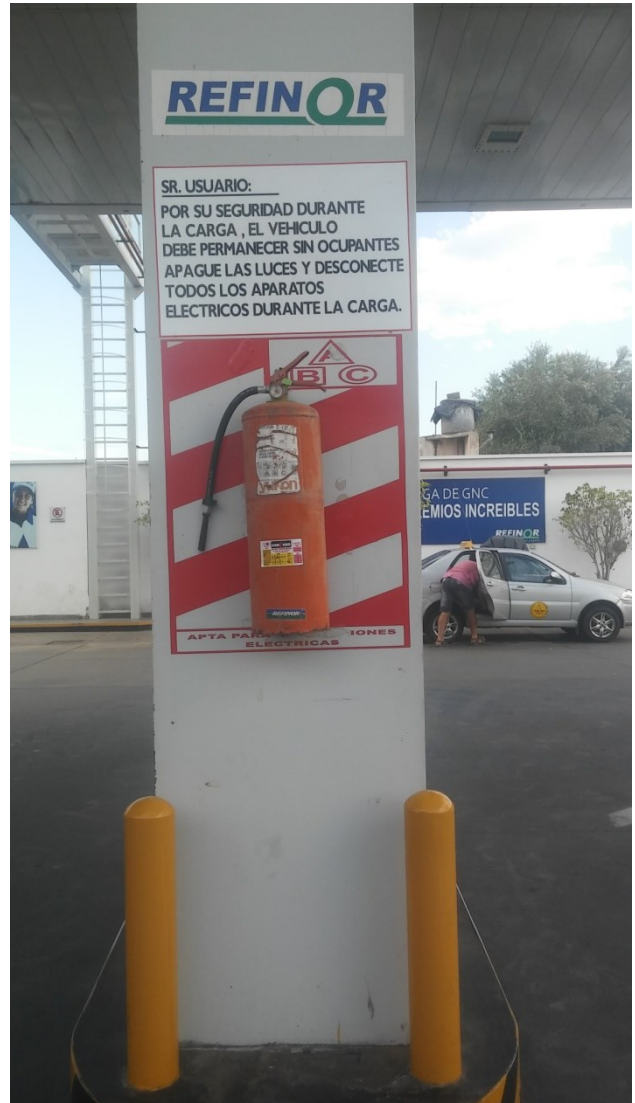
Identificación de equipos extintores